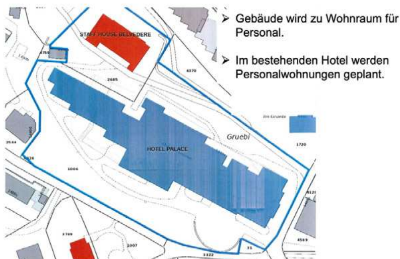
Abparzellierung eines Gebäudes für Personalwohnungen.

Die Gemeinde Lauterbrunnen belässt es nicht bei Aufrufen und Sensibilisierungsarbeit, sondern schafft auch konkrete Angebote. Eine Gelegenheit dazu bot sich in Zusammenhang mit dem leerstehenden Hotel Palace und dem dazugehörigen ungenutzten «Staff House». Die Gemeinde hat das «Staff House» abparzelliert und somit die Möglichkeit für verschiedenen Beherbergungsbetriebe eröffnet, ihr Personal dort unterzubringen. Aktuell (Stand Januar 2025) ist zudem in Mürren ein neues Personalhaus mit 13 Wohneinheiten geplant, welches durch die Schilthornbahn AG erstellt werden soll.