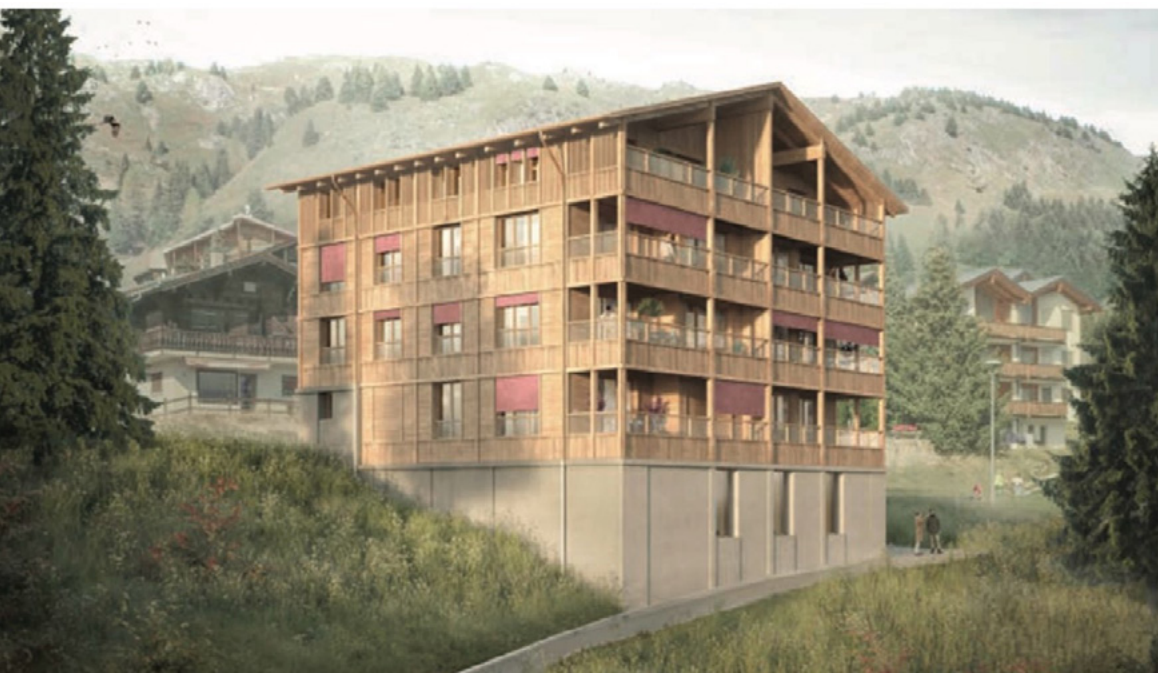
Fotomontage Wohnbaugenossenschaft «Malischa» auf der Riederalp.

Weil sich die Finanzierung schwierig gestaltet, ist die Realisierung der Projekte noch nicht gesichert.