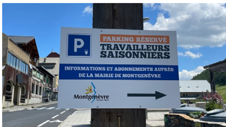
Parking für Saisonangestellte in Montgenèvre.

Wenn eine Gemeinde eine Wohnraumanalyse vornimmt und eine Wohnraumstrategie erarbeitet, sollte sie also unbedingt auch den Mobilitätsfragen eine besondere Beachtung schenken und dabei auf die spezifischen Bedürfnisse der Angestellten im Tourismus achten.